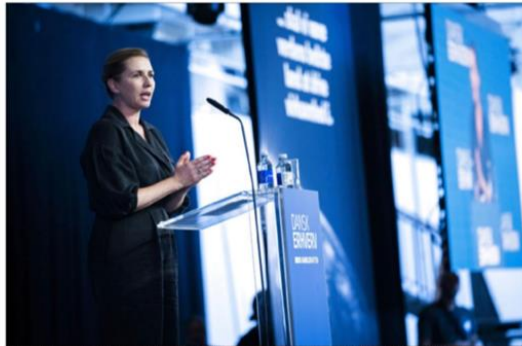
Til Dansk Erhvervs årsmøde roste Mette Frederiksen danske virksomheders forspring i digitaliseringen.

Myndigheder og politikere fortrinder ros for at have skabt gode